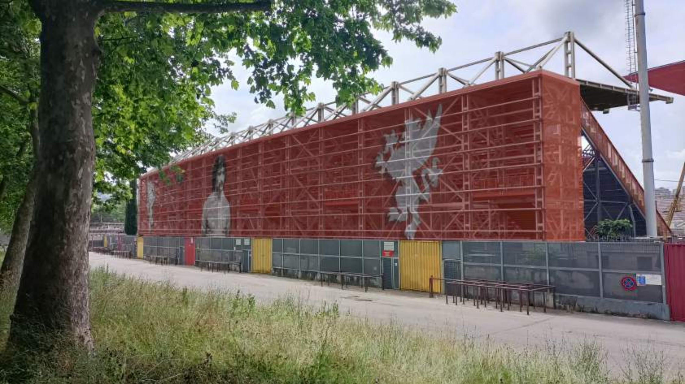
VISTA ESTERNA DELLA CURVA NORD