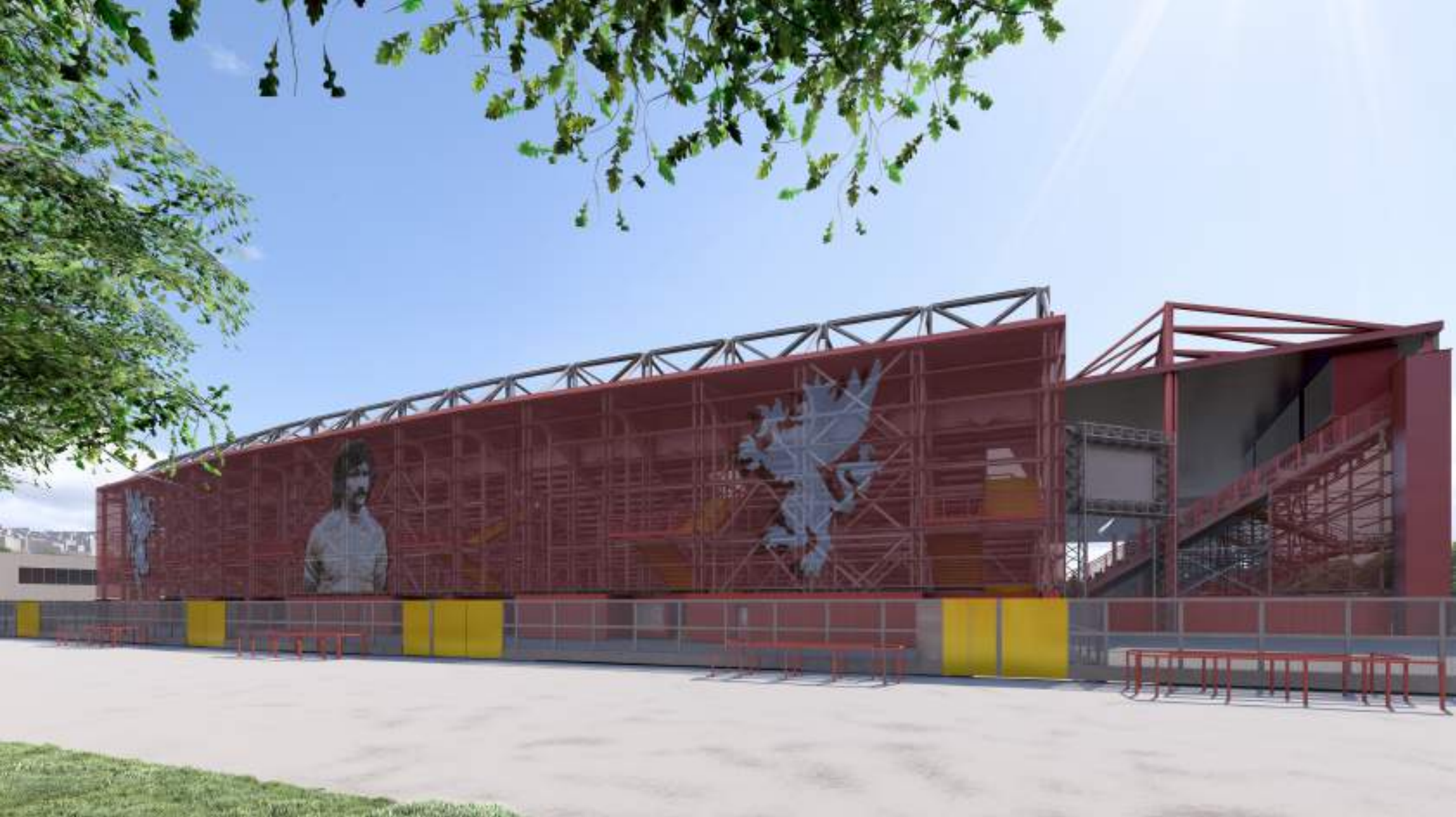
CURVA NORD Vista esterna