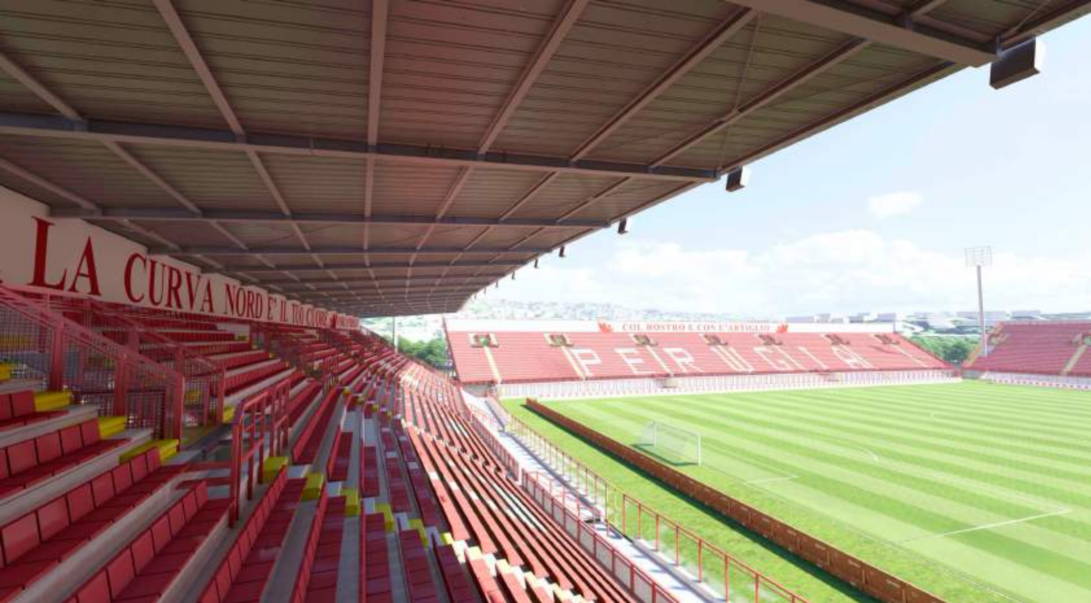
VISTA DALLA CURVA NORD