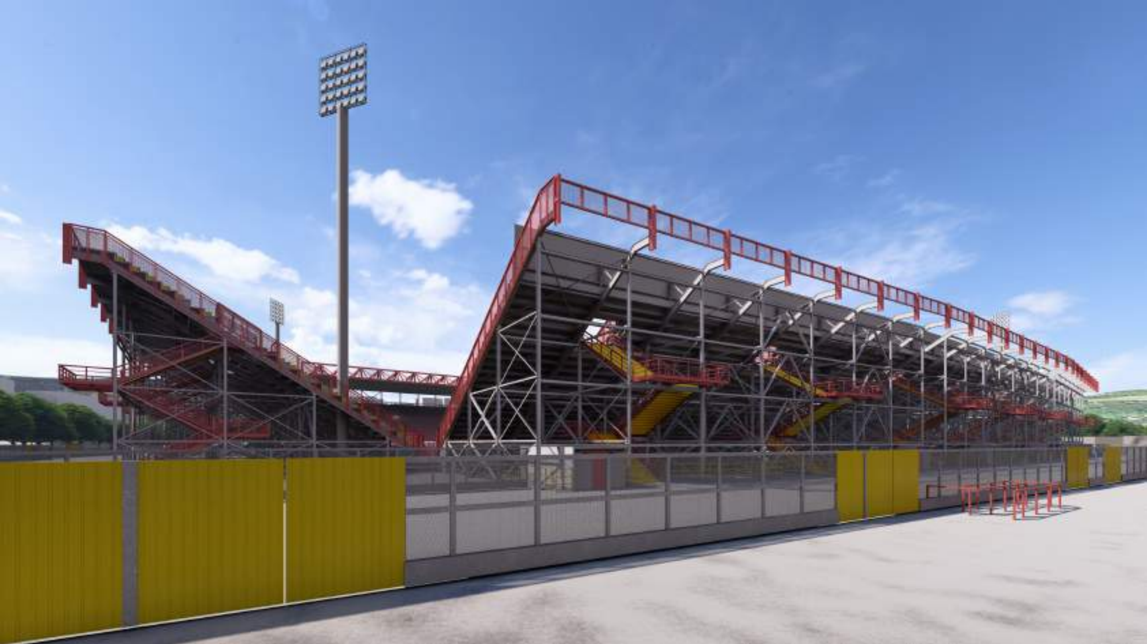
VISTA ESTERNA DELLA GRADINATA EST