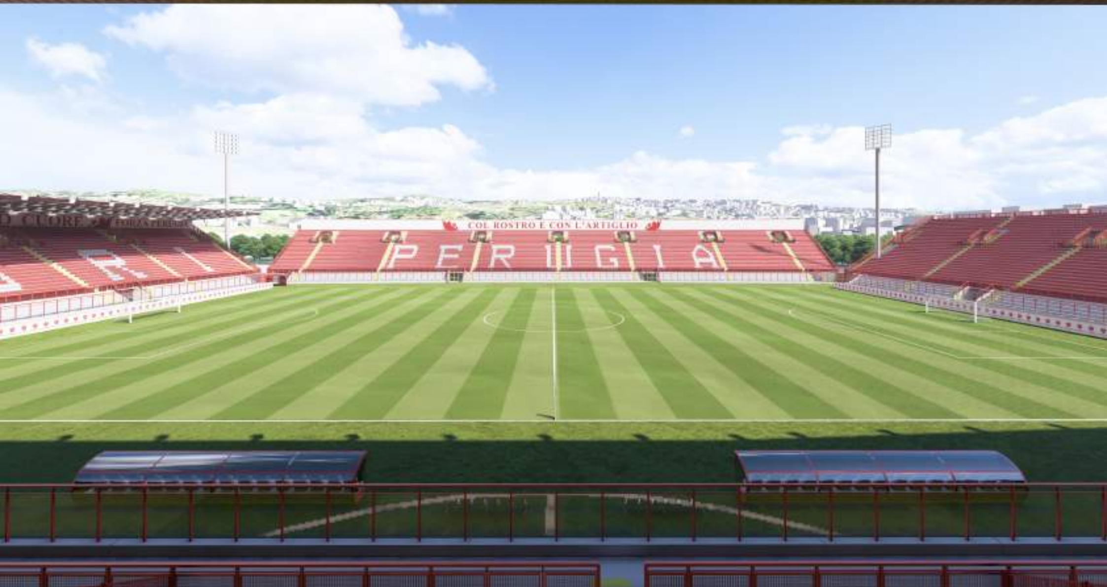
VISTA DALLA GRADINATA OVEST