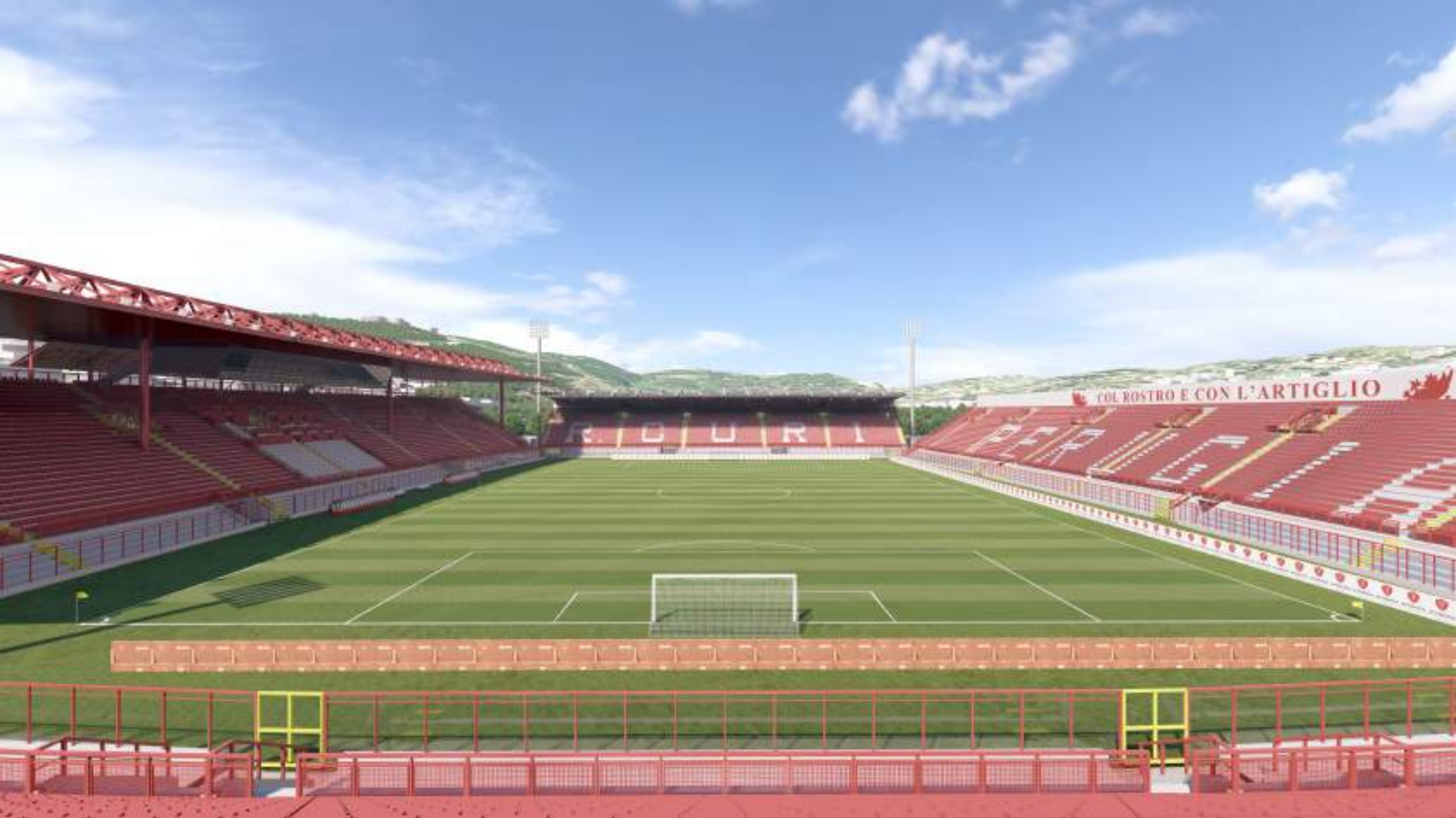
VISTA DALLA CURVA SUD