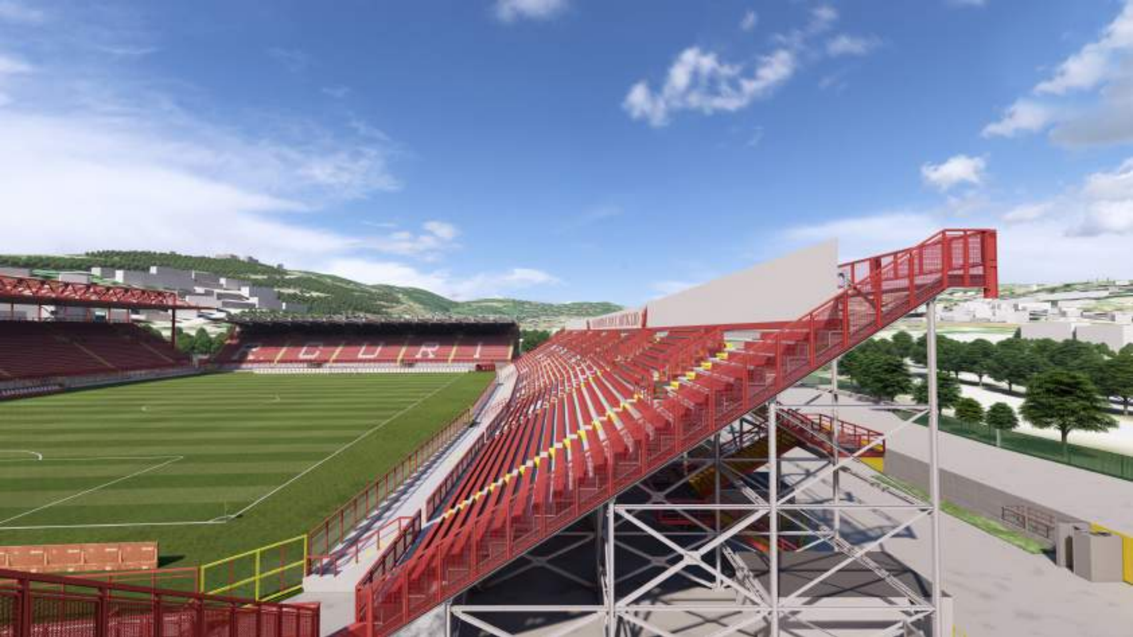
VISTA LATERALE DELLA GRADINATA EST