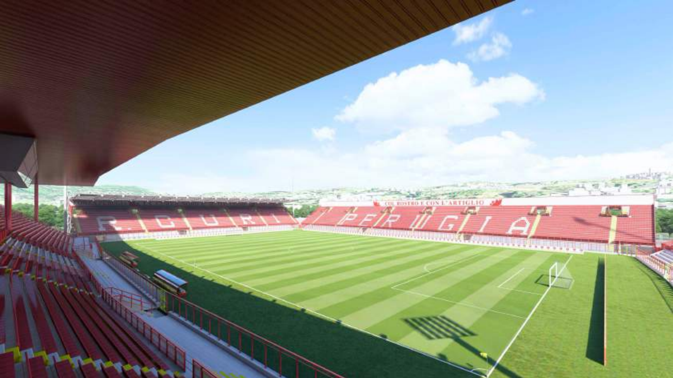
VISTA DALLA GRADINATA OVEST