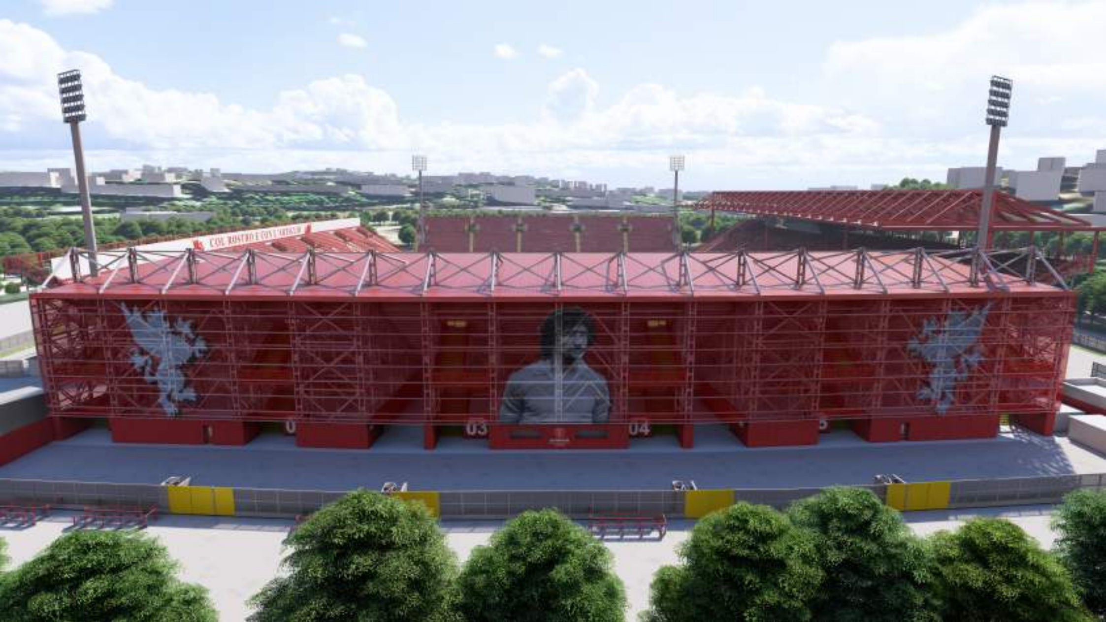
VISTA ESTERNA DELLA CURVA NORD