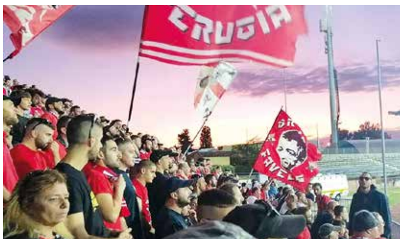
Empoli- Perugia 3-0.

La passione per i nostri colori prescinde da ogni risultato e categoria di appartenenza, chiarito questo concetto non possiamo negare che in questa stagione le aspettative dei tifosi siano veramente alte. La società ha messo a disposizione una rosa altamente competitiva e quindi siamo tutti convinti che si possa recitare un ruolo molto importante nell'attuale torneo cadetto.