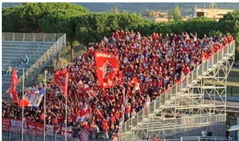
Empoli- Perugia 3-0. Settore perugino con oltre 800 sostenitori